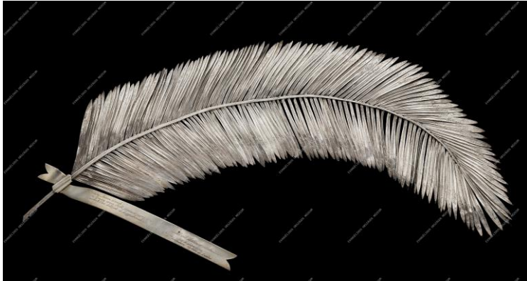
Ezüst pálmaág, 1931

Dicsó tehetség Ha felfedezni vélnek Jut egy pálmaág?