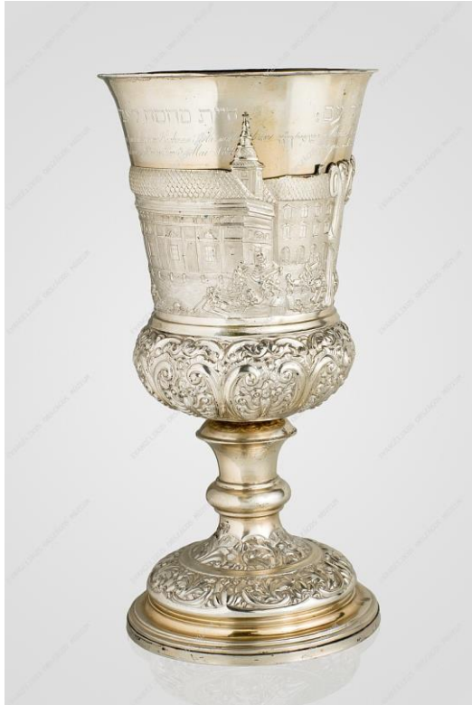
Árvízi kehely, 1838

Könnye felszárad Az örök hála cseppje Kehelyben nyugszik