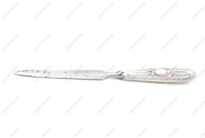
19. század végi ezüstözött levélfelbontó

Levelt írok A virtuális térben Billentyűt ütök