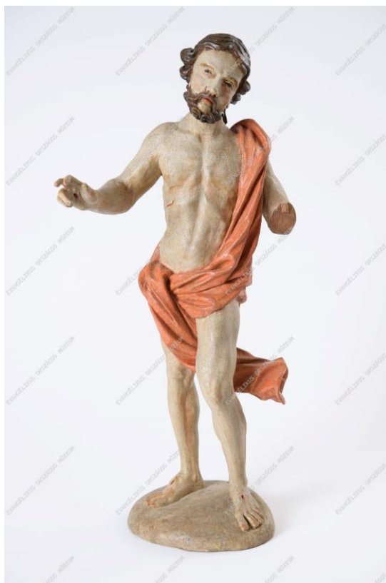
Feltámadt Krisztus szobra Vadosfáról, 17. század

Simogat engem Karja nélkül is érzem Magához ölel