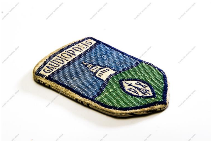
Gaudiopolis jelvény, 1946

Anyám nem nevelt Neki hogyan köszönjem Gondviselésem?