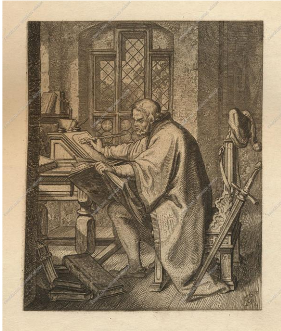
Gustav König: Luther németre fordítja az Újszövetséget, 1850

koronavírus Átírta a világunk Borús karantén