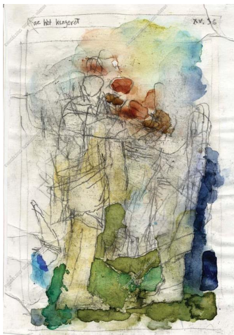
Karátson Gábor akvarellje Máté írása szerint való evangéliumhoz, 2017

Minden festett szín Bármilyen papírlapon Küld egy illatot