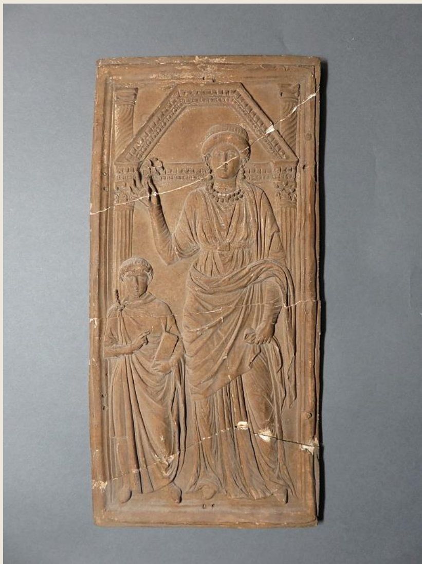
Stilicho diptichonja. Római, 390 k. / Diptych of Stilicho. Roman, ca. 390. Monza, Museo e Tesoro del Duomo di Monza.