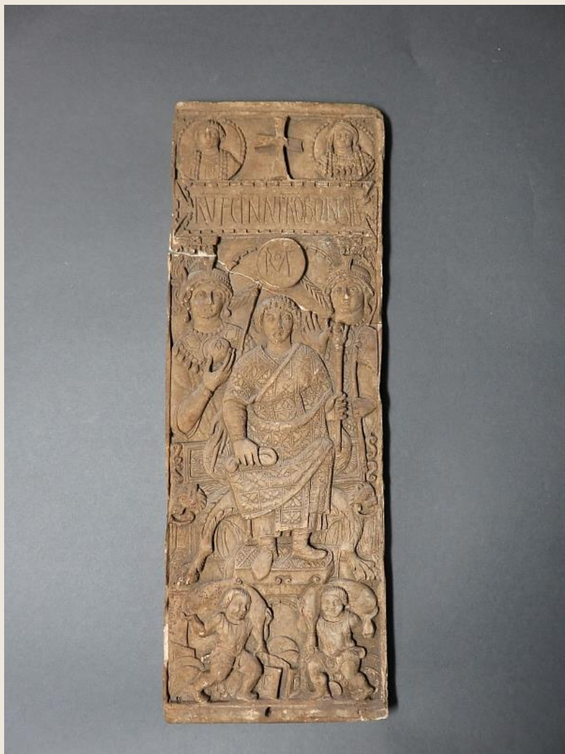
Rufius Gennadius Probus Orestes konzuláris diptichona / Consular Diptych of Rufius Gennadius Probus Orestes. Roma, 530. V&A Museum, London, inv. 139-1866