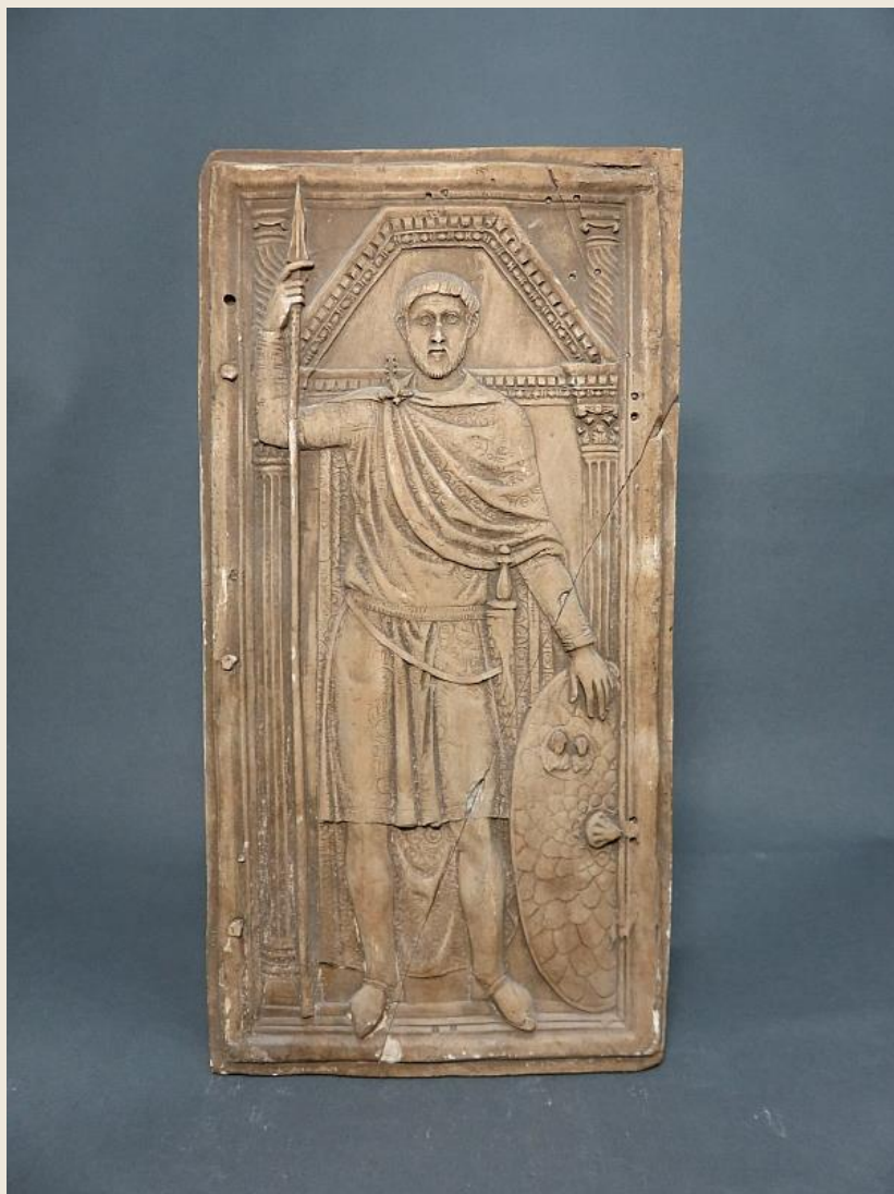
Stilicho diptichonja. Római, 390 k. / Diptych of Stilicho. Roman, ca. 390. Monza, Museo e Tesoro del Duomo di Monza.