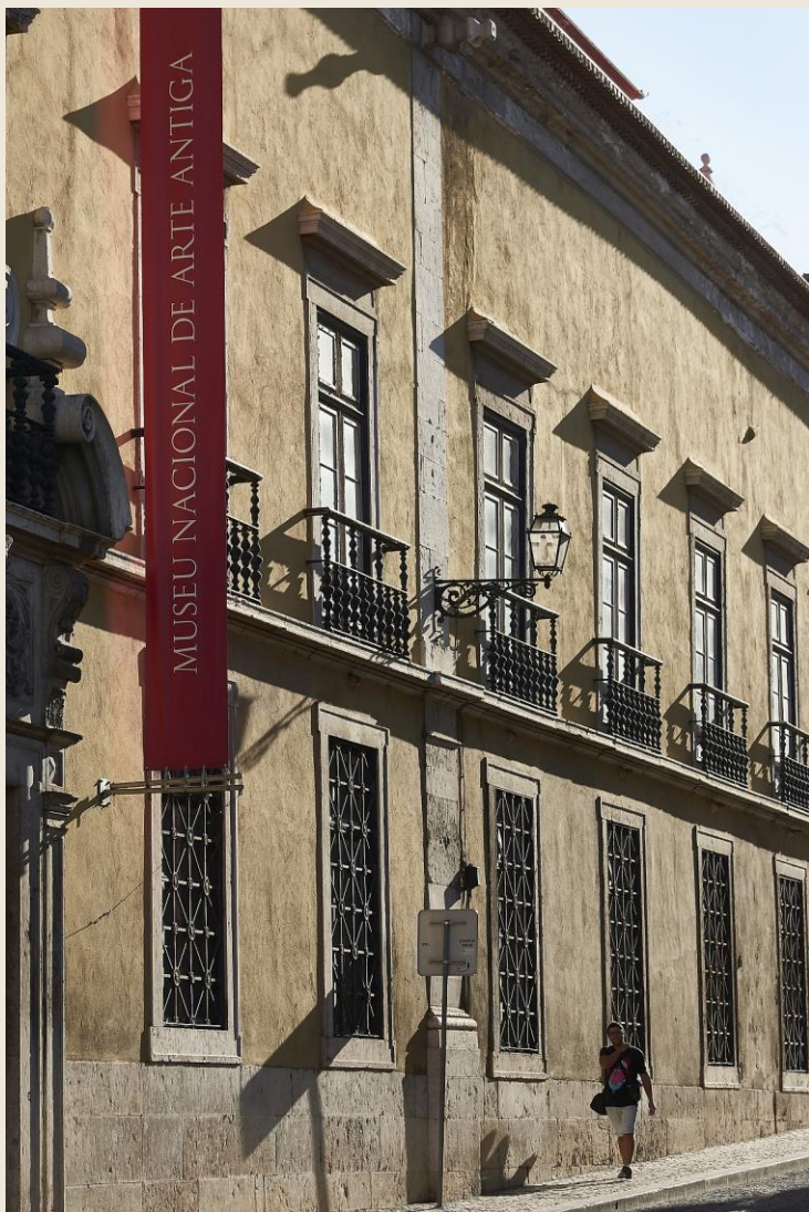
Museu Nacional de Arte Antiga, Lisszabon