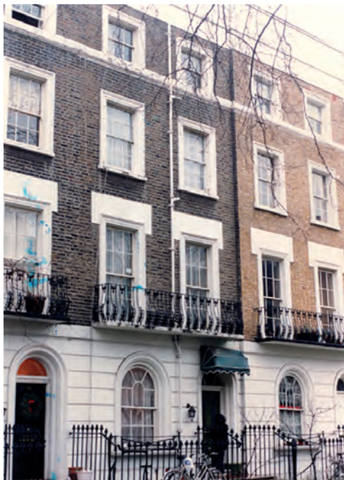
A Pulszky-ház Londonban

Pulszky sokat tett a Kütahyába internált Kossuth kiszabadításáért, még többet angliai és amerikai körútjainak sikeréért. Louis Bonaparte államcsínyre azonban jó néhány esztendőre visszafogta az emigrációs reményeket, és miután felesége és gyermekei is szerencsésen kijutottak, az ötvenes években – mai szóval élve – szabadfoglalkozású értelmiségiként, cikkei, előadásai honoráriumából, továbbá a Walter nagyszülők segítségével tartotta el családját. Tudománytörténeti érdeme, hogy egy nevezetes előadásával komoly hatást gyakorolt a British Museum kiállításpolitikájának megváltozására is. Mindezek miatt komoly a remény, hogy születésének bicentenáriumán a St. Petersburg Place épületén tábla örökíti meg londoni tartózkodásának emlékét.